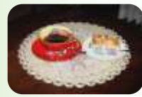
歌の後は超・ティータイム