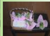
誕生日プレゼントの超・ミソケ

いつも笑顔いっぱい大賑わい。年に1、2度はスペシャル企画“ほろ酔いのタバ”でソロ熱唱! 次回は2月頃の予定、